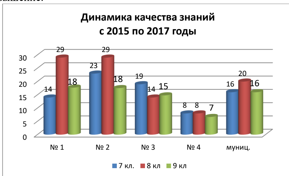
Диаграмма свидетельствует о том, что до 9 класса обучающиеся СОШ № 1, 4, ООШ № 2 более успешно справлялись с освоением программы.

Качество знаний в 9-ых классах в 1 четверти 2017/2018 уч. года имеет отрицательную динамику (сравнение качества обучающихся с 7 по 9 класс). В 2017 году качество знаний по муниципалитету составляет 16% (33 обучающихся). В МБОУ № 1, 2, 4 отмечено снижение показателя. В ООШ № 3 повышение.